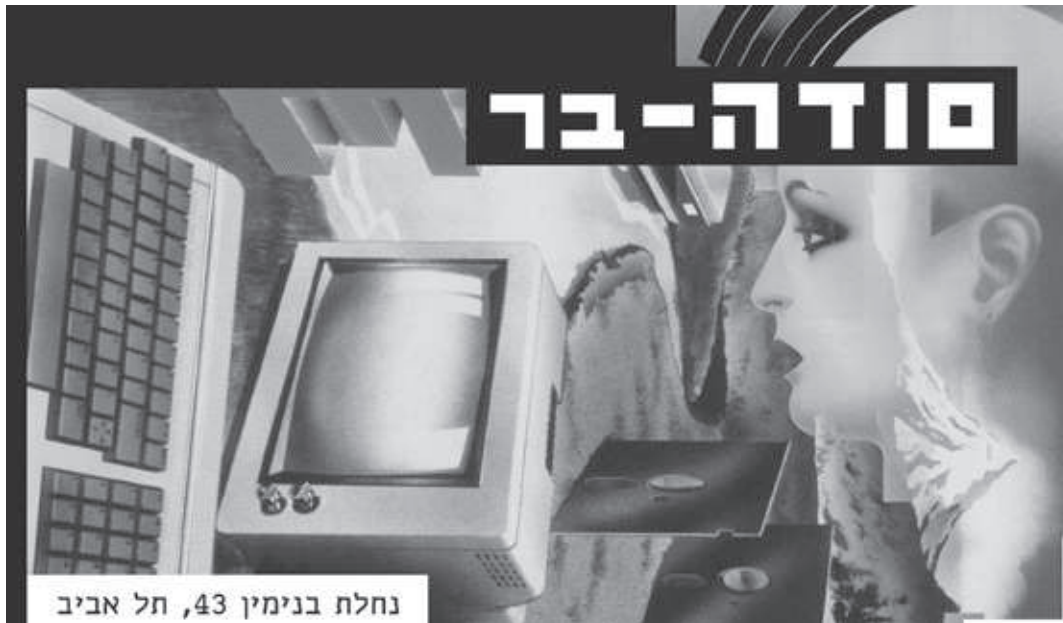
נחלת בנימין 43, תל אביב

בין ארבעת קירות היקום / חלון אחד מעליו שלט התכלית / מתחתיו קבר התחליט? ואניאת והם פה / ושומקום שם בינינו אין קשר דמים / בינינו קבר אחים אבל אין תכלית / לא פה ולא שם בין ארבעת קירות היקום / חלון אחד מאחוריו / עוד יקום ועוד יקום אחד / ללא מתים ללא קברים ללא חלונות / רק אני ואף קצת אחרים / הם התכלית היקום החליט